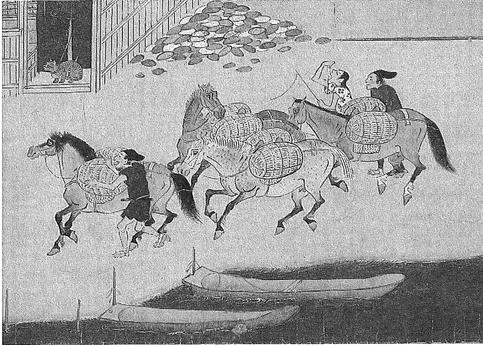
『石山寺縁起絵巻』(石山寺所蔵, 部分)

X 図に描かれたような運送業者は、馬の背に荷物を載せて陸路を往来し、ときには徳政を求めて蜂起した。