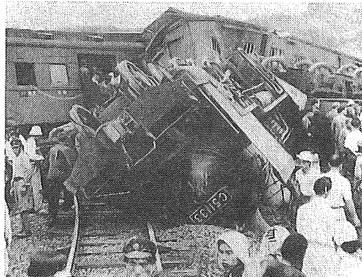
X 千葉県(総武本線飯岡駅)